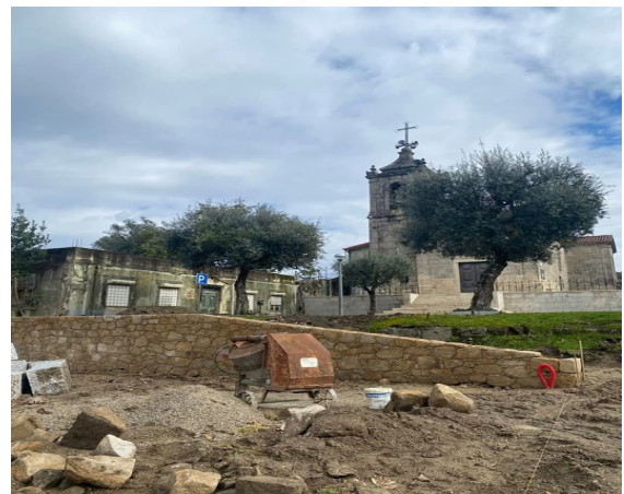
Requalificação do Adro Igreja de São Pedro de Este