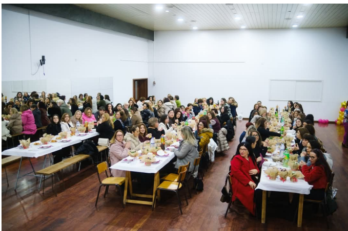
A 3ª edição Jantar das Mulheres de Este